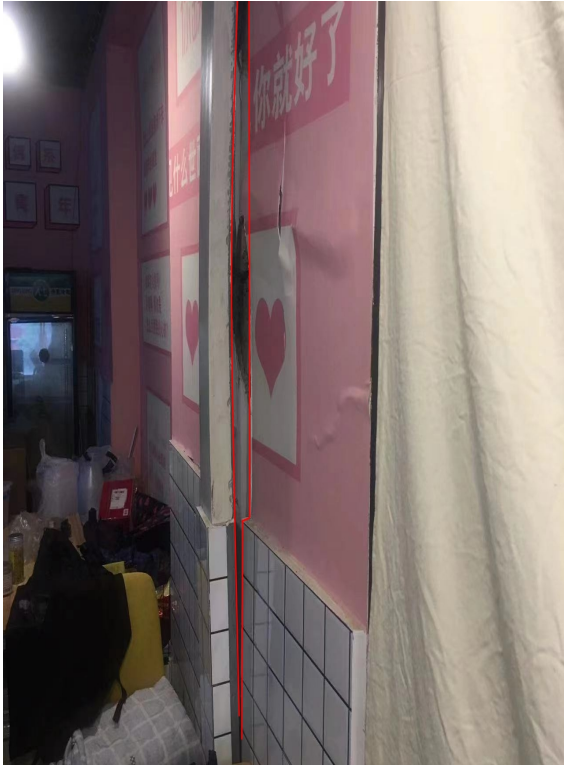
图 1 事发前夕二层餐馆员工拍摄的照片