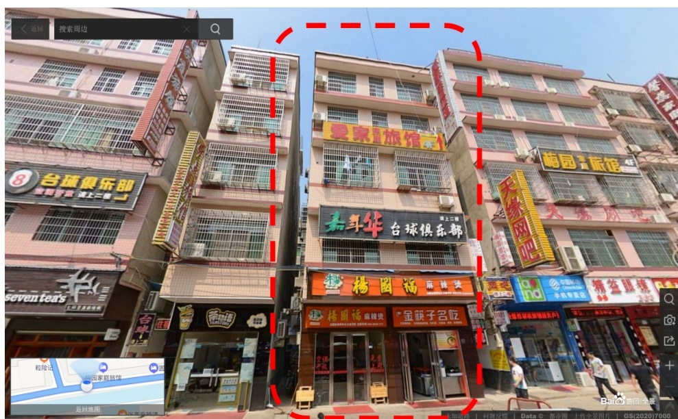
图3 加层扩建前原自建房南向立面照片

道，8月加层扩建基本完成后谎称供个人及家人使用，由南通九茂机电设备有限公司安装电梯，未办理电梯安装和使用登记手续，但开凿电梯井道、电梯自重及运行对房屋倒塌无影响。调查还排除了地基、人为破坏、气象、地震、燃气泄漏等导致倒塌的因素。