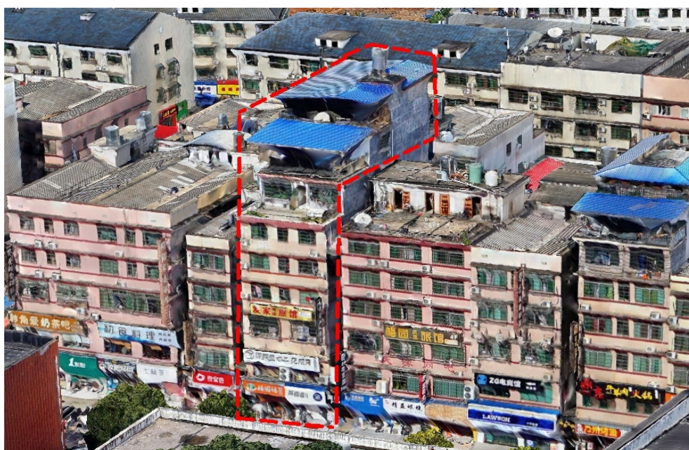
图4 加层扩建后涉事房屋东南向立面照片